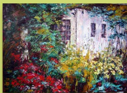
Artículo 17. Inmaculada Company

Óleo, acuarela, pintura digital, cerámica, escultura, fotografía y técnica mixta realizados por artistas de la Asociación "Espejo de Alicante"